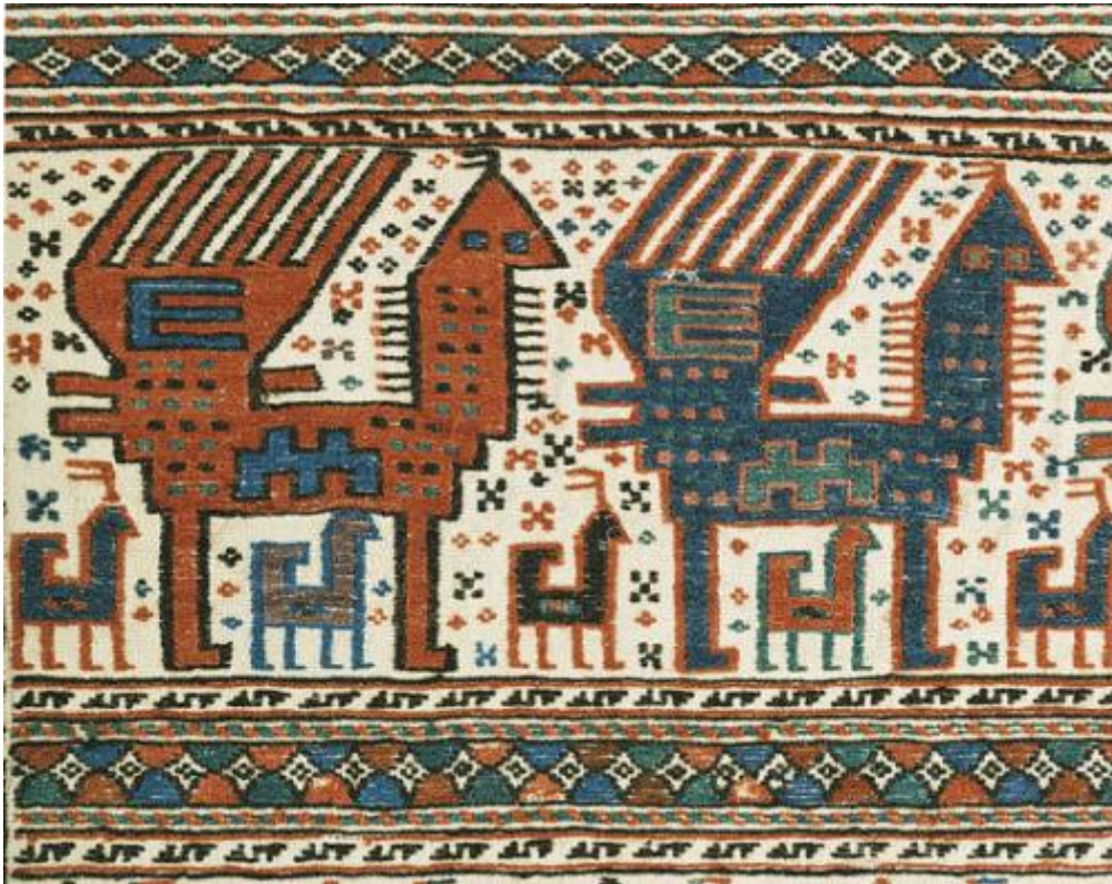
Czaprak (fragm.), Kaukaz, w. XIX/XX, Kraków, Zamek Królewski na Wawelu