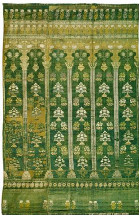
Makata arkadowa, Persja, w. XVII/XVIII, Kraków, Zamek Królewski na Wawelu