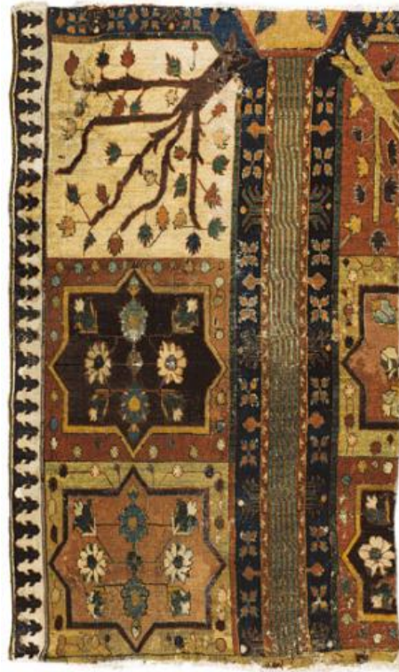
Kobierzec tzw. ogrodowy (fragm.), Persja północno-zachodnia, Kurdystan (?), w. XVIII, Kraków, Zamek Królewski na Wawelu