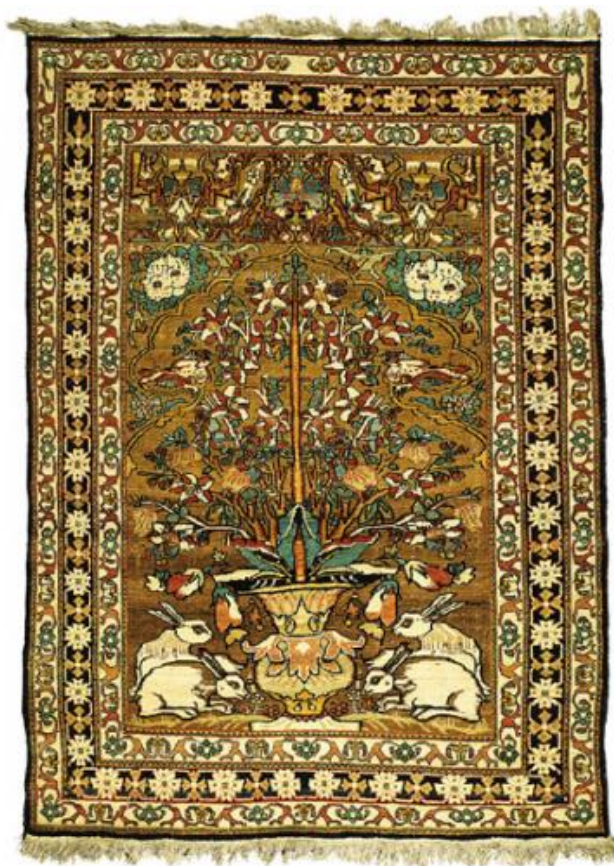
Kobierzec modlitewny typu "kirman", Persja wschodnia, w. XIX, Kraków, Zamek Królewski na Wawelu