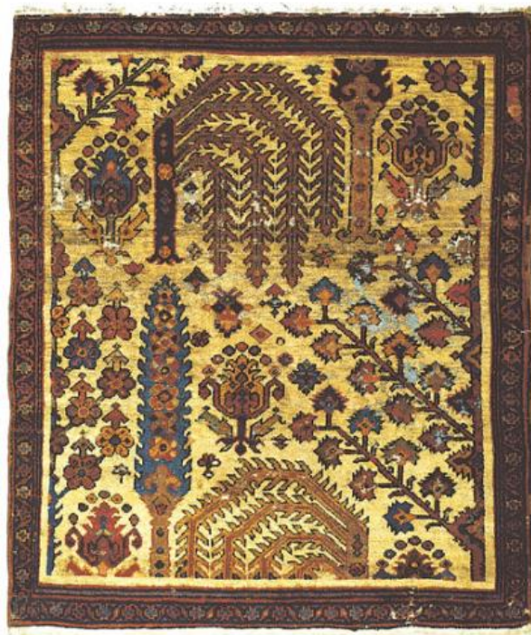
Kobierzec tzw. ogrodowy, Persja północno-zachodnia, Kurdystan (?), w. XVIII, Kraków, Zamek Królewski na Wawelu